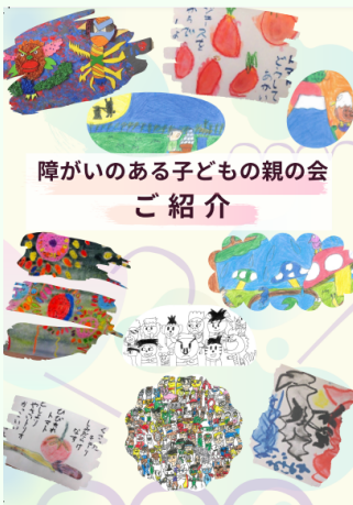
障がいのある子どもの親の会 ご紹介

令和3年度は、ご協力いただきました募金を活用し、県内障がい児者保護者の会の冊子を作成いたしました。 各市町村、学校等1,500ヶ所へ配布することができました。