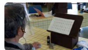
発声法を学んでいます

喉頭がんや咽頭がん、食道がんなどで声帯を摘出し、声を失った人（喉頭摘出者）が日常生活における会話を可能にし、「社会復帰」や「明るい家庭生活が過ごせること」等のお手伝いをしている団体です。