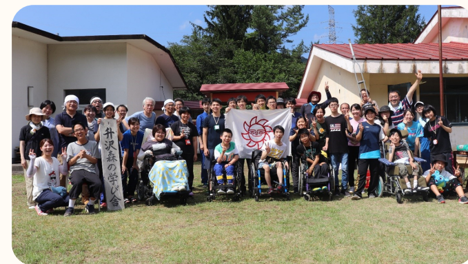
第48回きぼっこキャンプ 令和元年夏

きぼっこキャンプ実行委員会 (ボランティア団体) と共催。夏5泊6日・冬2泊3日。子どもたちはトレーニングを受けたボランティア (18~26歳) と共に自分たちの共同生活を創っていきます。 (昭和47年~)