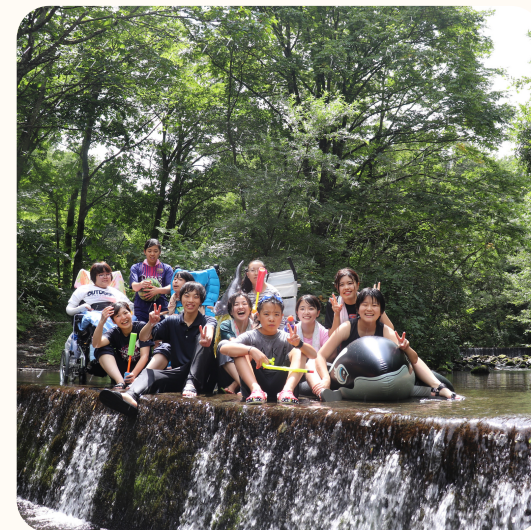
子どもたちがプログラムを創って楽しめます。