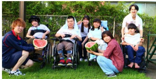
～第52回夏のきぼっこキャンプ～