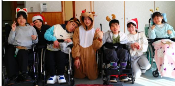
～第52回冬のきぼっこキャンプ～